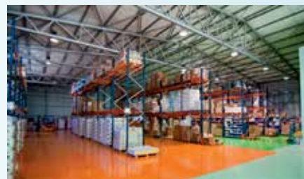
Κατάστημα στον Γέρακα, Αττικής