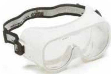
UNICO GRABER helico typ II medical EN 166/170 U FIT U MATCH