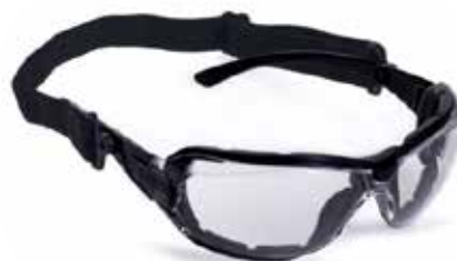
UNICO GRABER 4600 EN 166/170 U SPORT