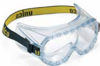
UNICO GRABER grand prix medical EN 166/170 U MATCH