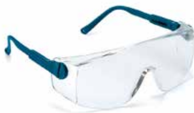
UNICO GRABER 5000HF EN 166/170