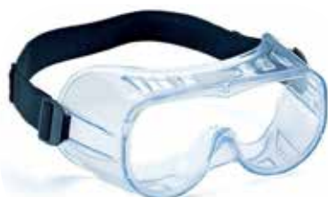
UNICO GRABER helico typ II EN 166/170 U FIT U MATCH

Απλά προστατευτικά γυαλιά τύπου μάσκας με λάστιχο Regular protective goggles with elastic band.